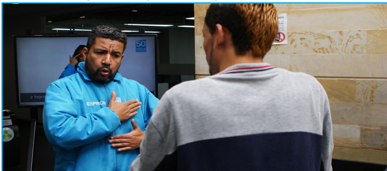
Funcionario del IDIPRON brindando atención a ciudadano con discapacidad auditiva.

El Sistema Distrital de Discapacidad, desde la Agenda Estratégica aprobada por el Consejo Distrital de Discapacidad, viene trabajando en el objetivo 'Accesibilidad' con el interés de disminuir las barreras físicas, comunicativas y actitudinales que enfrenta esta población en el Distrito.