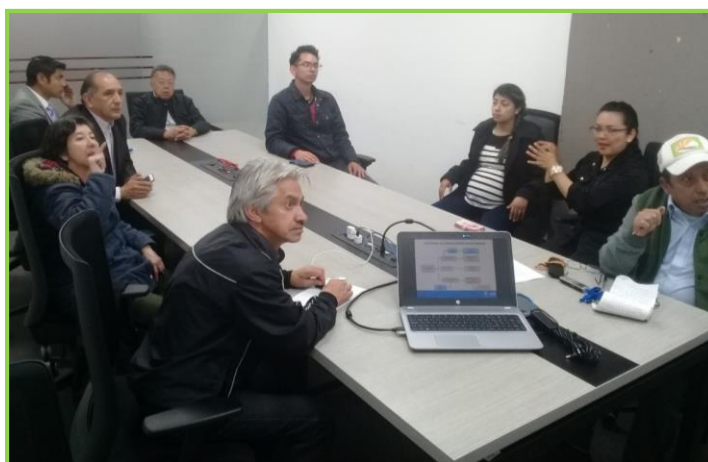
Representantes con discapacidad auditiva de Bogotá 2018

El objetivo principal de este encuentro que lideró el Sistema Distrital de Discapacidad fue cualificar a los representantes en diferentes temáticas relacionadas con la discapacidad, normatividad y funcionamiento del Sistema Distrital de Discapacidad, además de generar un proceso de cohesión del representante Distrital con los locales para fortalecer la participación en las diferentes instancias del Sistema. Video en lengua de señas Aquí.