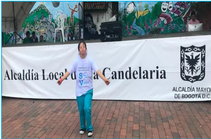
Muestra cultural con artistas con discapacidad

Esta estrategia cultural le brindó un reconocimiento especial a las capacidades, habilidades y talentos de las personas con discapacidad de la localidad, logrando así su visibilización y posicionamiento, tanto de ellas, como de sus familias, cuidadores y cuidadoras.