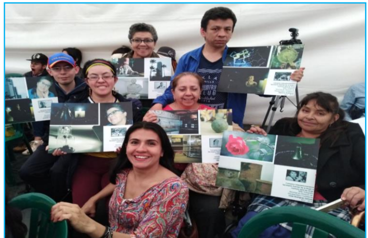
Mujeres diversas muestran el resultado del taller fotográfico