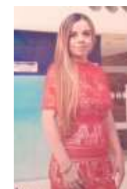
Mile Cortés Asociación de Vecinos