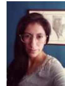
Waira Zamora Expresiones Urbanas