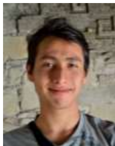
Julián Bautista Medios/Comunicación