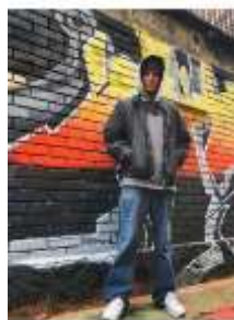
Steven Acosta Graffiti/Arte Urbano